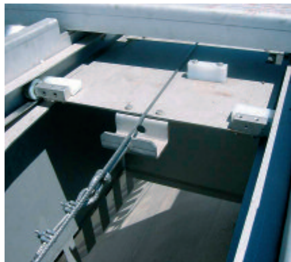
Principio de funcionamiento Ro5 HD