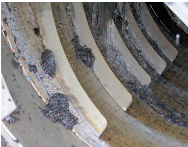
Separación óptima de fibras