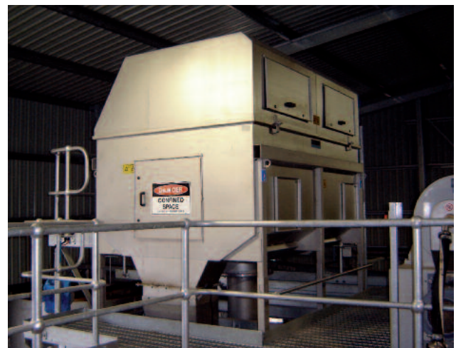
Tamiz de Tambor Rotatorio ROTAMAT® RoMesh® para la separación óptima de partículas muy finas