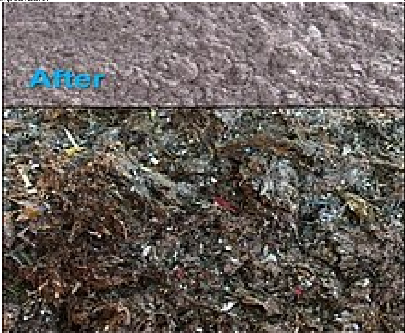
Fig. 3 - antes / después de STRAINPRESS® y criba