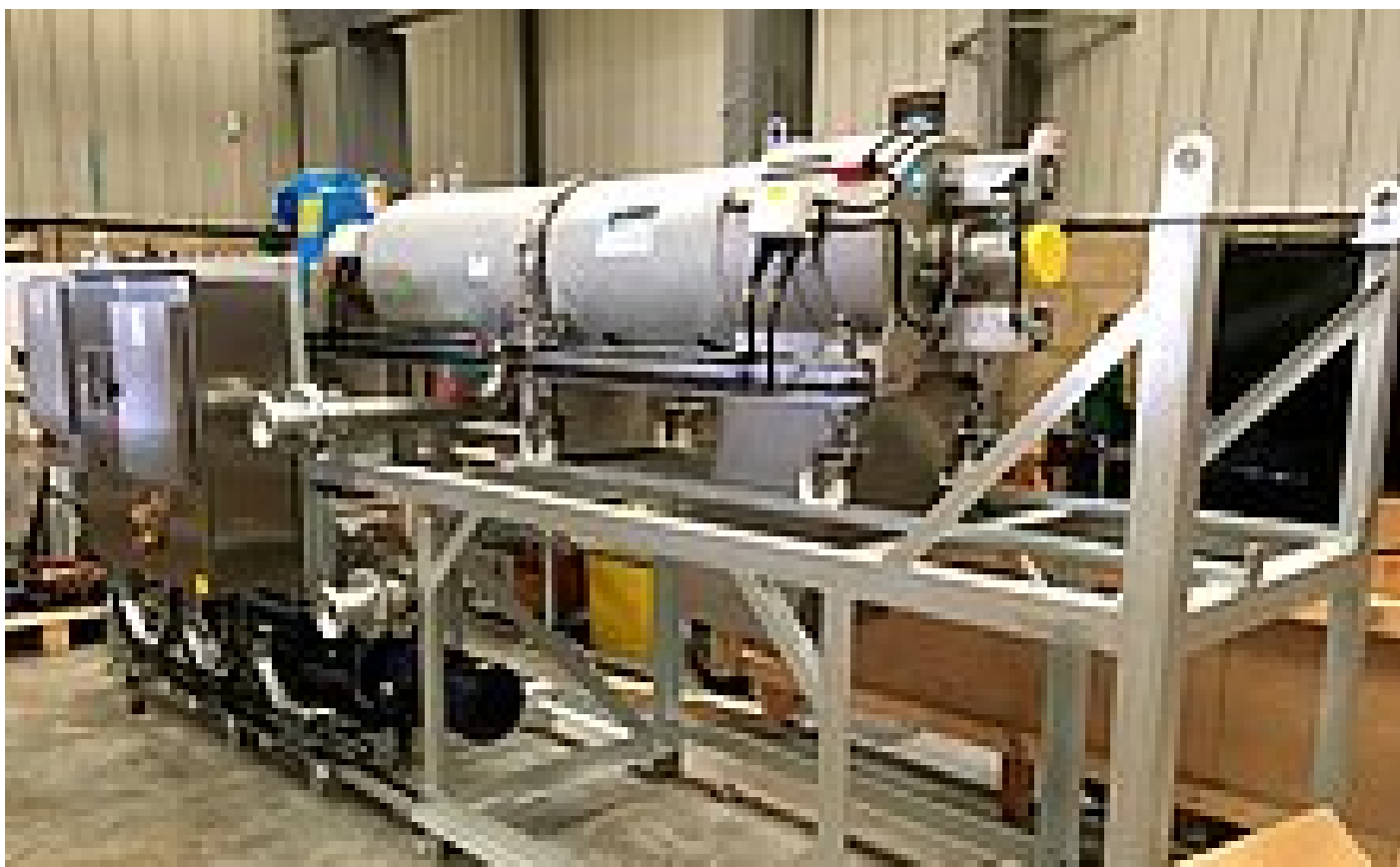
Fig. 5 - Planta de demostración premontada con bomba de alimentación y sistema de control

Si se van a utilizar residuos de fermentación como fertilizante, se deberá reducir la proporción de plásticos. En HUBER hemos utilizado con éxito una STRAINPRESS® para retirar plástico de varias plantas. Tamiz prensa para fangos STRAINPRESS® elimina el plástico y