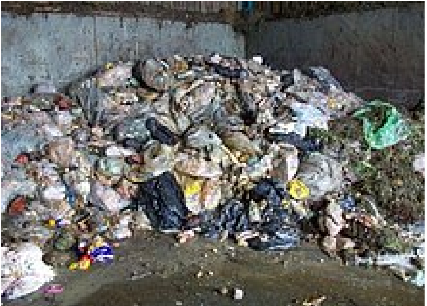
Fig. 1 – Ejemplo residuos de alimentos

En las plantas de fermentación de residuos, una mezcla de diferentes residuos de alimentos de diferentes orígenes termina, algunos en envases comerciales, otros con una cantidad considerable de plástico. Para poder reciclar los residuos, los restos de comida utilizables se separan del material de envasado en una planta especial. Como efecto secundario, algunas de las piezas de plástico se desintegran en trozos demasiado pequeños y, por lo tanto, ya no pueden eliminarse. Estos separadores hacen un buen trabajo de retención de las piezas más grandes y voluminosas, pero no pueden eliminar el 100% del plástico. Como el plástico no se puede descomponer, pasa a través del sistema y fluye con el digestato.