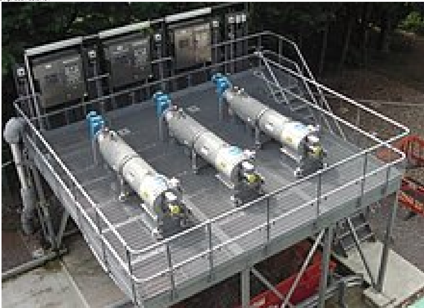
Fig. 4 - Tres máquinas STRAINPRESS® montadas sobre plataforma, con armarios de distribución y protección anticongelante