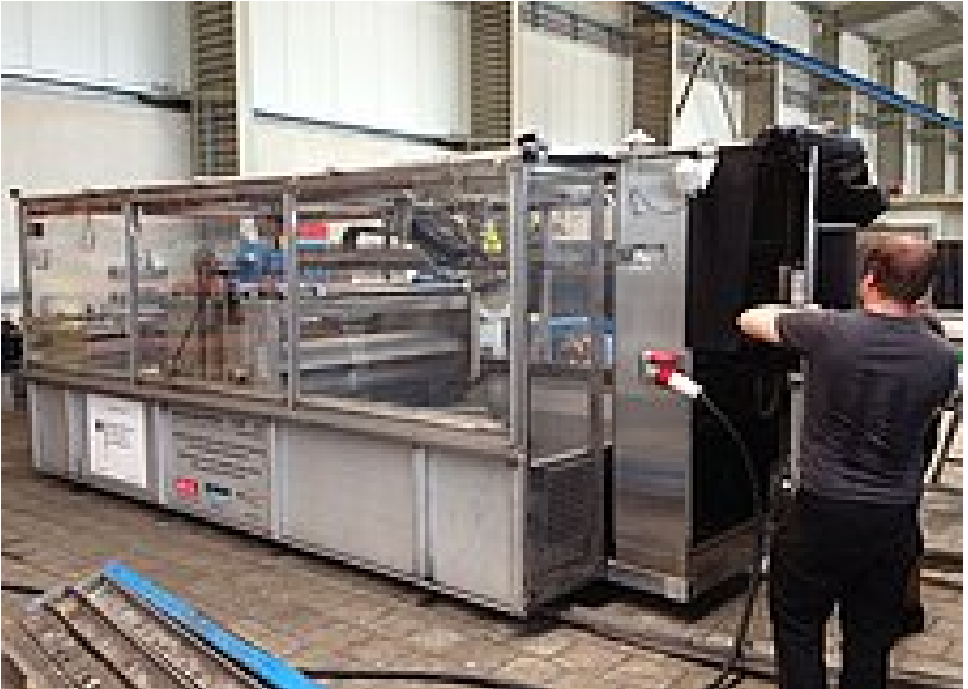
Regresa el secador solar pequeño en la verificación del mando en la nave de servicio